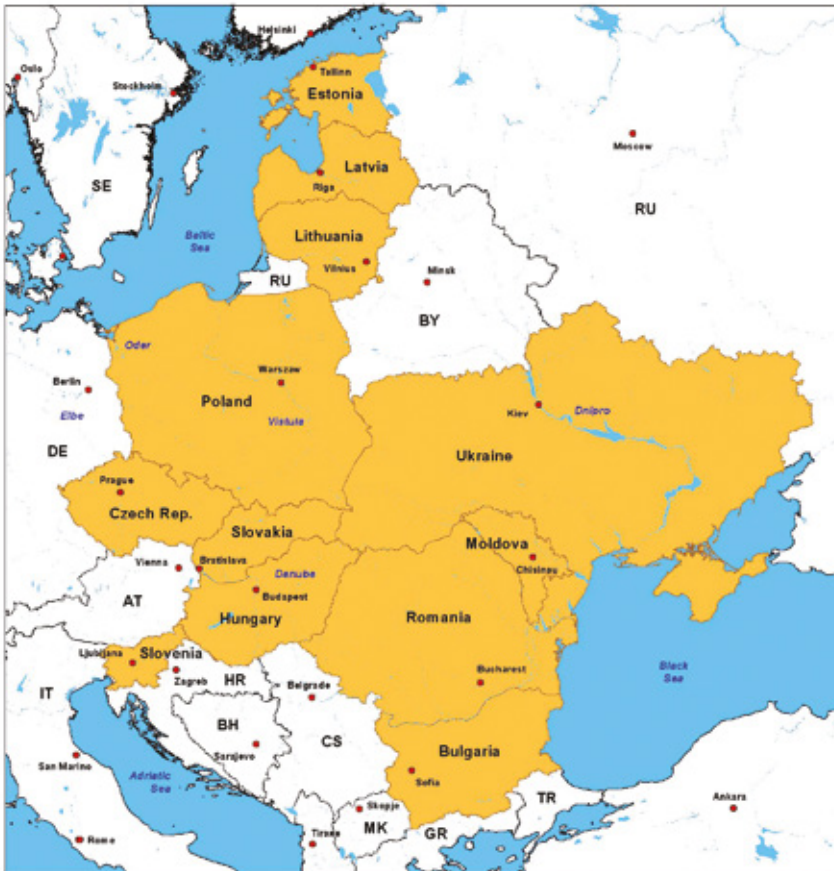
1. ábra – Kelet- és Közép-Európa országai

Kelet- és Közép-Európa területének nagysága mintegy 1,1 millió km 2 , és nagyjából a Balti-tenger, illetve a Fekete-tenger vízgyűjtőjén helyezkedik el (1. ábra).